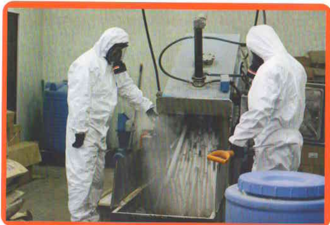
Установка утилизации ртутьсодержащих отходов в химико-радиологической лаборатории